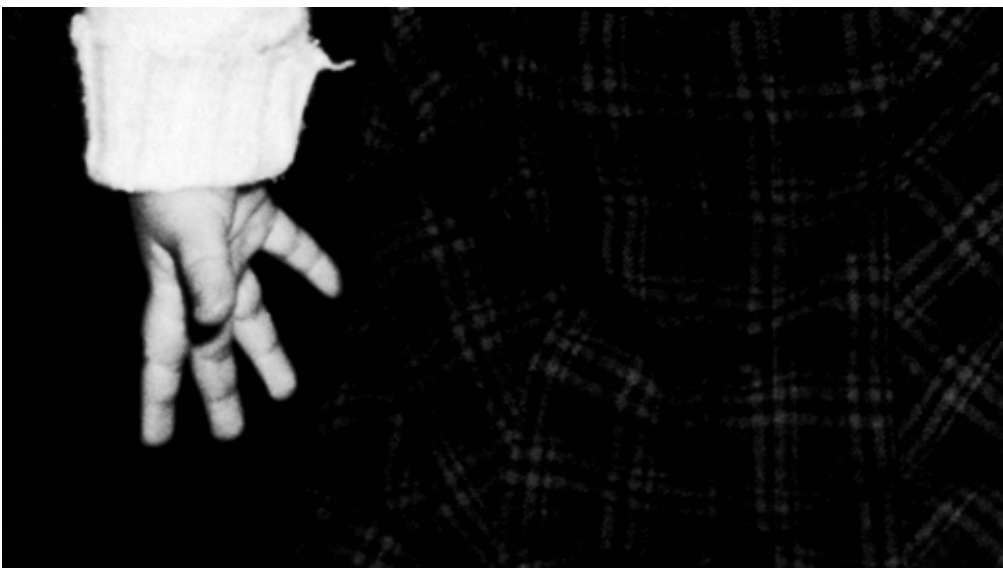
Suture No. 3