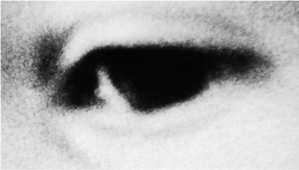
Suture No. 1