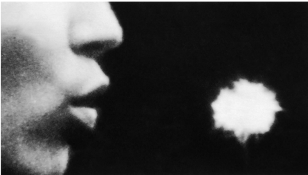
Suture No. 2